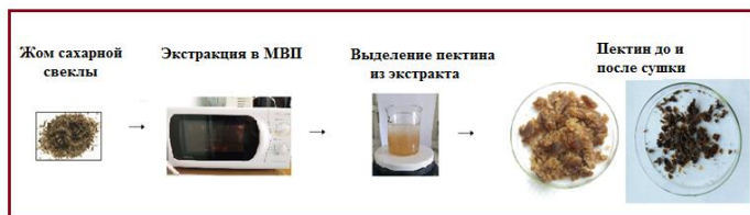
Рисунок 1 – Основные этапы извлечения пектина из жома сахарной свеклы

Экстракция пектина из жома сахарной свеклы включает следующие основные этапы: экстракция пектина микроволновой обработкой, очистка пектина и сушка. Общая схема извлечения пектина из жома сахарной свеклы представлена на рисунке 1.